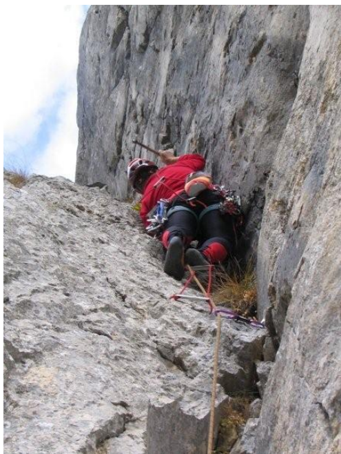
Šprana v plotu