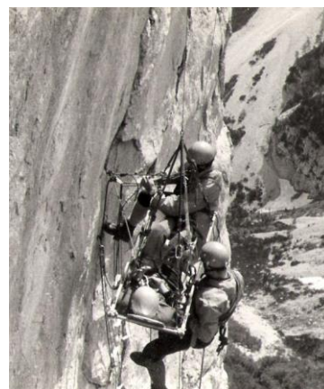
Vaje GRS leta 1968