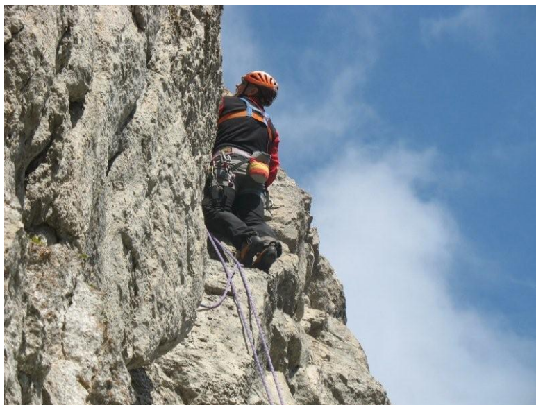
vstop v Lastovičji rep