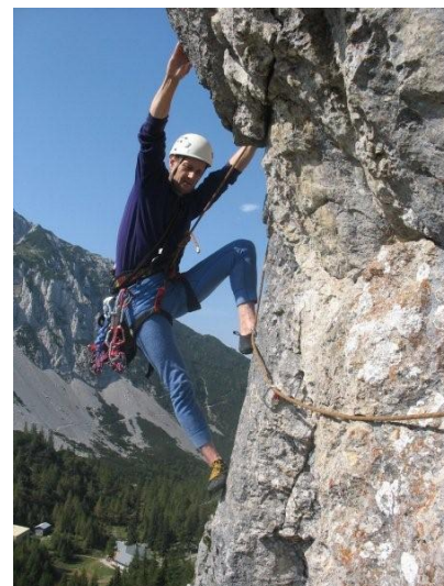
Smer gorskih reševalcev